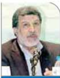
مر تفضی لطفی