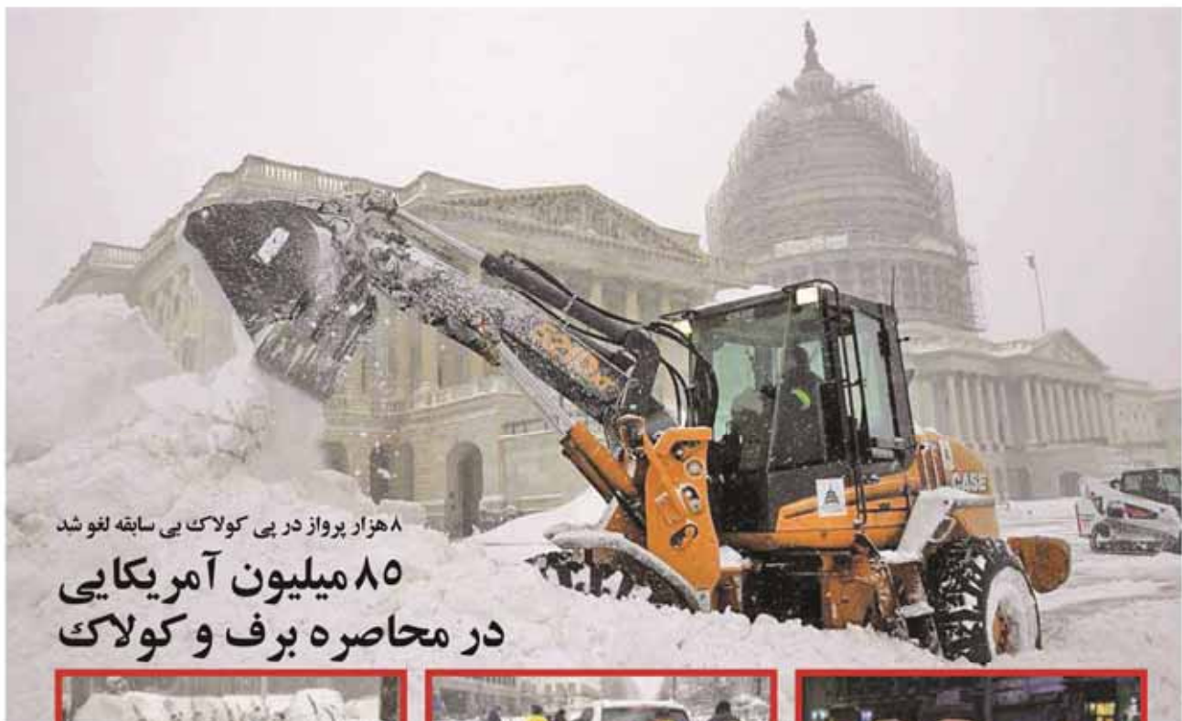
۸ هزار پرواز در پی کولاک بی سابقه لغو شد