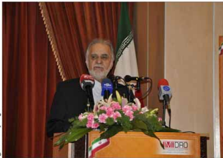
نگارنده: عصر اقتصاد - خدایاری

رئیس هیات عامل سازمان توسعه و نوسازی معادن و صنایع معدنی ایران (ایמידرو) خاطر نشان کرد: ایران برای همکاری با کشورهای مختلف در این بخش مانعی ندارد اما اصل استفاده از ظرفیت و امکانات کشور است که ما از طرف‌های خارجی استقبال می‌کنیم.